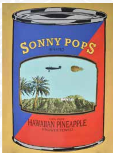
「SONNY POPS BRAND HAWAIIAN PINEAPPLE」