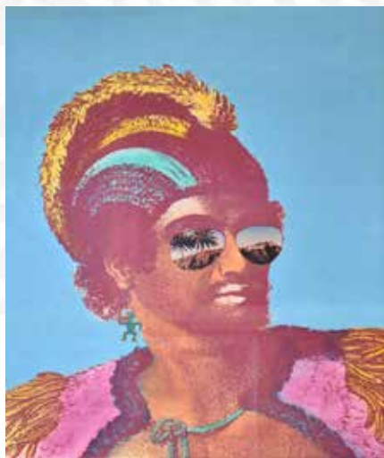
「SHADES OF HAWAII」