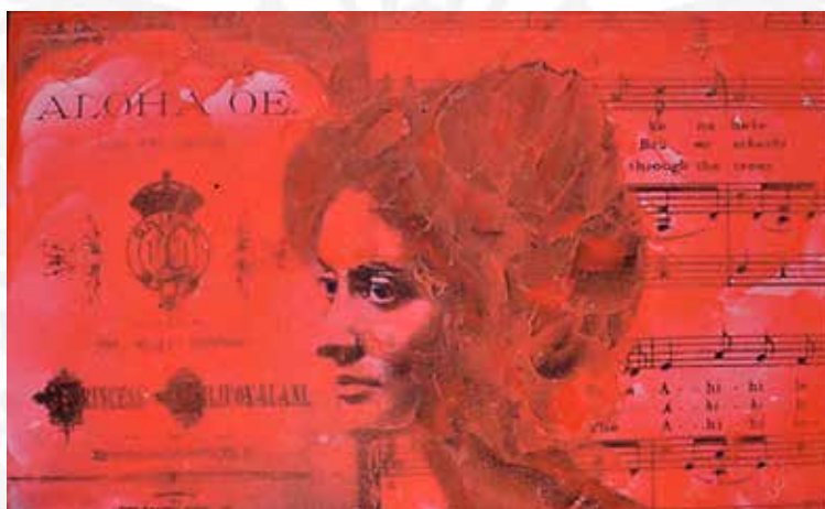
「PRINCESS KAIULANI THE MOST BEAUTIFUL HAWAIIAN ROYAL ALOHA OE」

ラグジュアリー・ロウは「ファッション・ミーツ・アート (Fashion Meets Art)」のコンセプトの元に、ハワイのコミュニティに芸術文化を根付かせ、ハワイのアーティストがグローバルに活躍できるよう尽力している。今回のサニー・ポップス回顧展もその一貫で、アートとファッションへの理解を深めてもらうことを願っている。