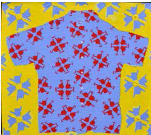
「STOP AND SMELL THE SHAKAS」