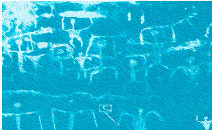
「PETROGLYPH WITH SELFIE STICK」

*サニー・ポップスとロバート・シーゲル (ラグジュアリー・ロウ共同オーナー) へのインタビューのご予約も受け付けています。