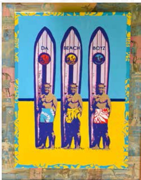
「DA BEACH BOYS」